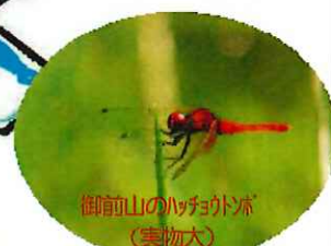
御前山のハチョウトブ(実物大)